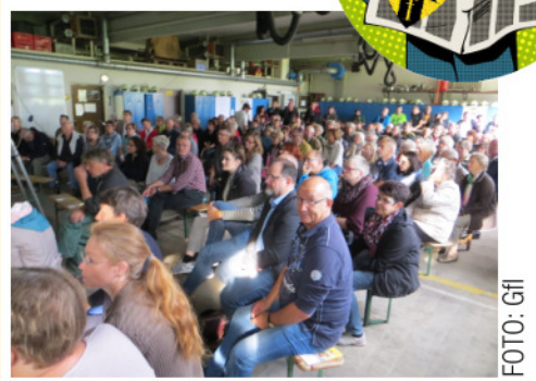
Infoveranstaltung „Dorfladen Immensen“ - ein voller Erfolg 180 Zuhörer lassen sich 2,5 Stunden informieren

Alle weiteren Schritte werden, wie bisher transparent und mit regelmäßiger Information der Öffentlichkeit durchgeführt - wie es hier zum Beispiel durch diese „Dorfladenzeitung“ geschieht.