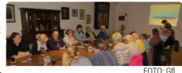
Konstituierung der ersten Arbeitskreise zum Thema Dorfladen

Alle Arbeitskreise konnten mit einer arbeitsfähigen und motivierten Anzahl an Mitstreitern besetzt werden. Dafür recht herzlichen Dank! Eine Steckbriefvorstellung einzelner Personen aus den Arbeitskreisen